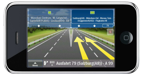
ClearTurn™ für eine realitätsnahe Darstellung von Autobahnausfahrten.

Die Verbindung zwischen Reiseführer und Navigation kennt man von Falk bereits durch die mobilen Navigationssysteme. Diese Tradition setzt sich auch beim iPhone fort. Die Navigationslösung von Falk ist die erste mit kompatibelem Reiseführer. Die seit Anfang Oktober 2009 am Markt befindlichen Falk Guides lassen sich geschickt mit dem Falk Navigator kombinieren. Der Falk Guide Wien, inklusive aller zuladbaren Audioinformationen, ist standardmäßig vorin-